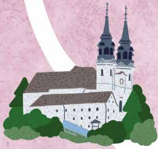
PÖSTLINGBERG ペストリングベルク