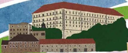
SCHLOSSMUSEUM UND ALTSTADT