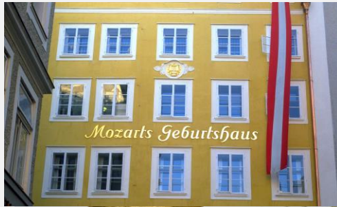
Mozarts Geburtshaus, Salzburg