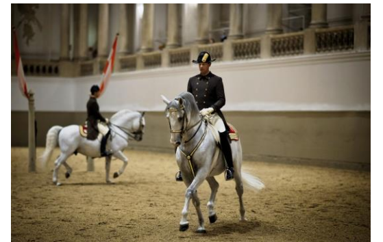
Spanische Hofreitschule, Wien